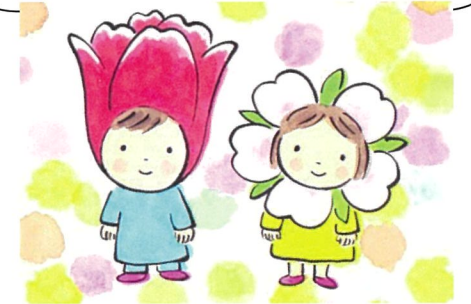
イラスト 大月書店絵本 「あなたこそたからもの」より

「核戦争から子どもの命を守ろう」と始まった母親大会は、子育て、教育、暮らし、防災、平和など、その時々願いを持ち寄って話し合い、学びあい、今年で62年の歴史を積み重ねてきました。一人で悩まず、みんなで支え合い、知恵を出し合い、手をつなぎましょう。男性も大歓迎! みなさんお誘い合わせてお越しください。