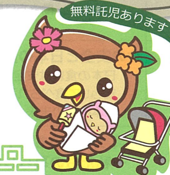
フッピー 袋井市キャラクター