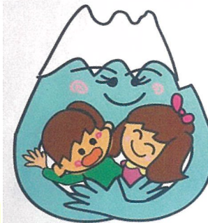
イラスト：鈴木直子